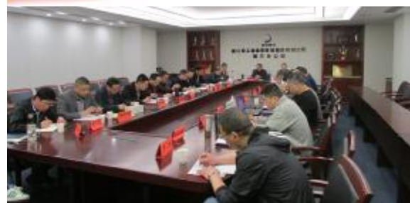
三分公司开展《宪法》、《监察法》学习

编者按 第十三届全国人民代表大会第一次会议通过并公布实施了《中华人民共和国宪法修正案》后，在公司本部开展《宪法》学习宣传后，公司所属单位也广泛开展尊崇宪法、学习宪法、遵守宪法、维护宪法、运用宪法宣传教育活动，营造崇尚宪法的浓厚氛围。 党委工作部