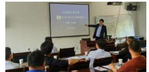
职业教育培训中心开展《宪法》学习