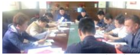
机电工程分公司开展《宪法》、《监察法》学习