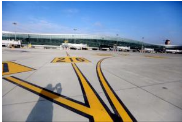
温州机场新建 T2 航站楼通过竣工验收