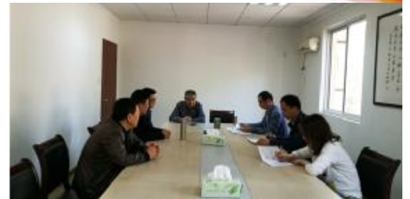
中心试验所开展《宪法》学习