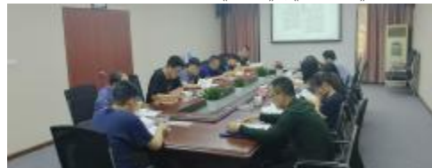
建筑安装分公司开展《宪法》学习