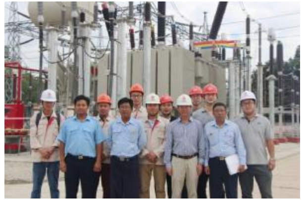
缅甸 230kV 贝因依变电站扩建项目管理人员合影

本报讯 4月7日，四分公司承建的河北中煤旭阳焦化有限公司 6#、7# 焦炉配套 170t/h 干熄焦发电工程余热