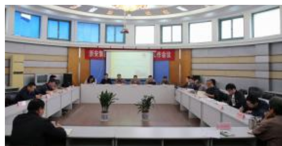
五分公司开展《宪法》、《监察法》学习