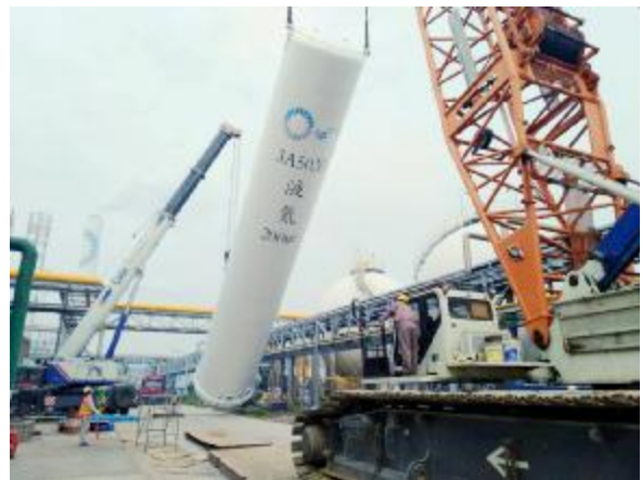
泰兴项目两台液氮罐跨管廊吊装一次成功