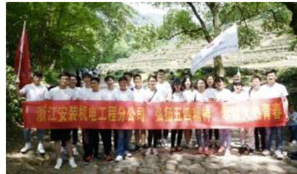
机电工程分公司毅行活动合影