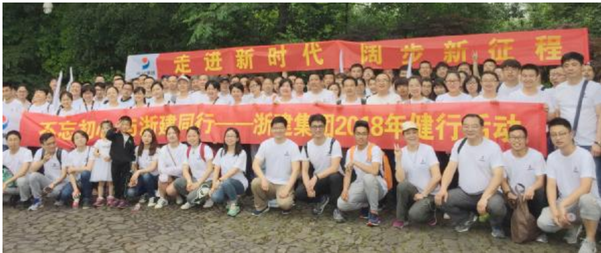
浙建集团职工健行活动合影