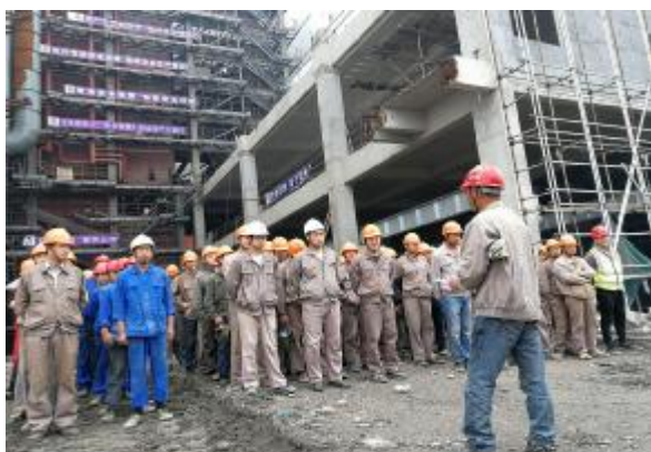
四分公司瑞安项目举行安全生产月启动仪式