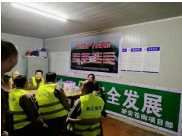
四分公司苍南项目组织施工人员进行安全知识竞答