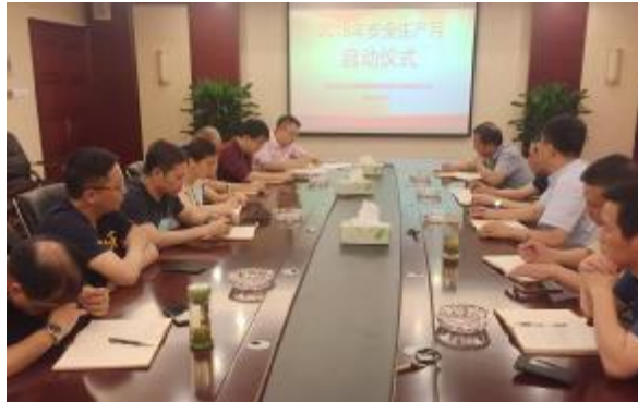
四分公司举行“安全生产月”活动启动仪式