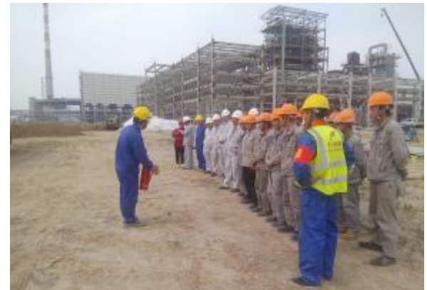
上海分公司山东新和成项目开展消防演练