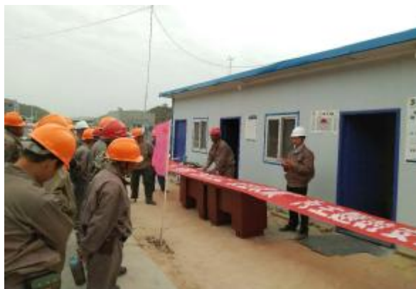
四分公司陕西志丹项目举行安全签名活动