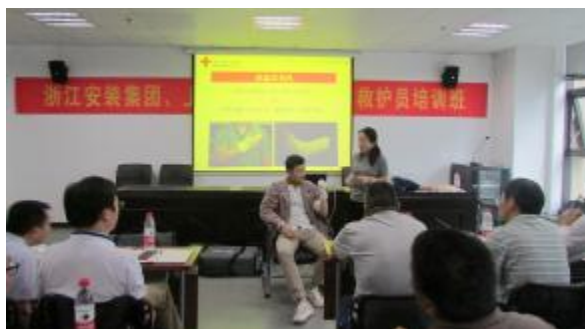
公司联合杭州市上城区红十字会举办救护员培训班