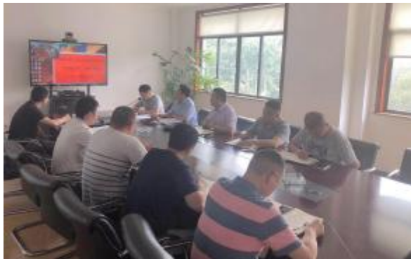
二分和空分工程分公司召开“安全生产月”活动启动会议