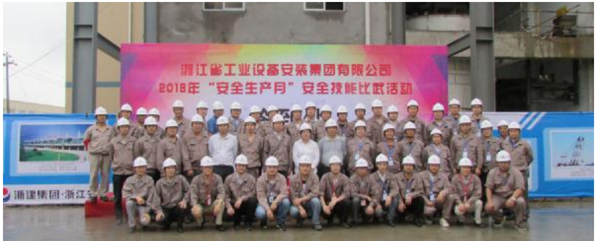
公司举办2018年“安全生产月”安全技能比武活动