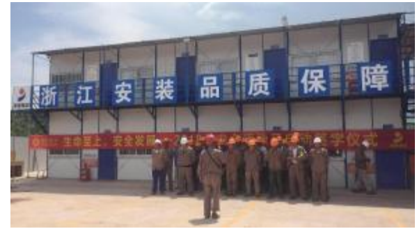
四分公司广西博白项目举行安全签名活动