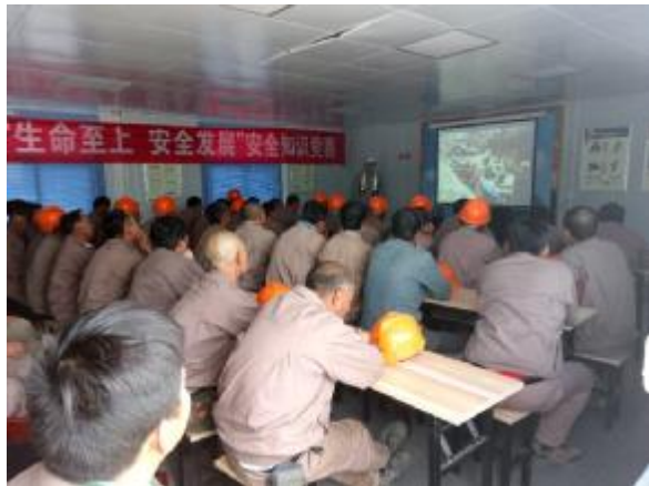
四分公司青海大美项目组织学习安全知识