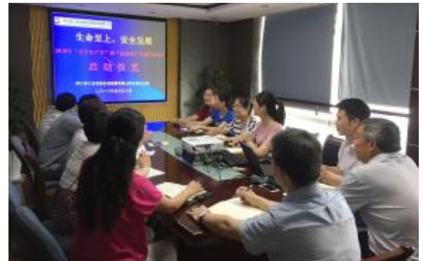
北京分公司举行“安全生产月”活动启动仪式