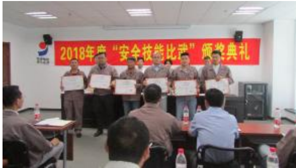
公司“安全技能比武”颁奖典礼

为弘扬全国2018年安全生产月“生命至上 安全发展”主题，增强全员安全意识，提升全员安全素质，公司及所属各分公司项目部积极开展安全技能比武、签名宣誓、应急演练等安全生产月活动，现摘取部分活动照片，以飨读者。