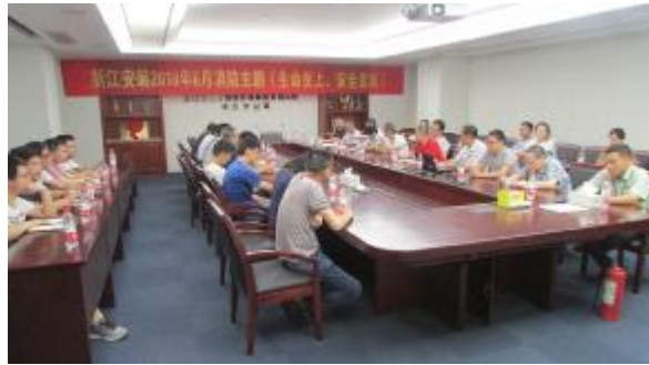
三分公司举办消防安全知识培训