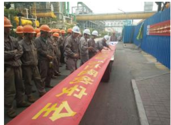
四分公司河北中煤旭阳项目开展安全生产签名活动